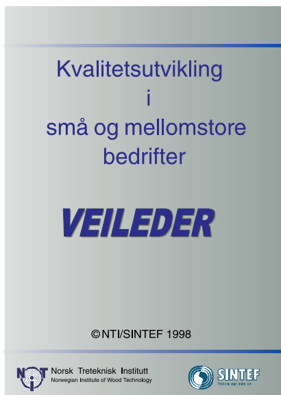
Figur 2: Veileder brukt i prosjektet.

lingen. I tillegg til generelle beslutnings- og problemløsningsverktøy, er det utviklet metoder og verktøy for: