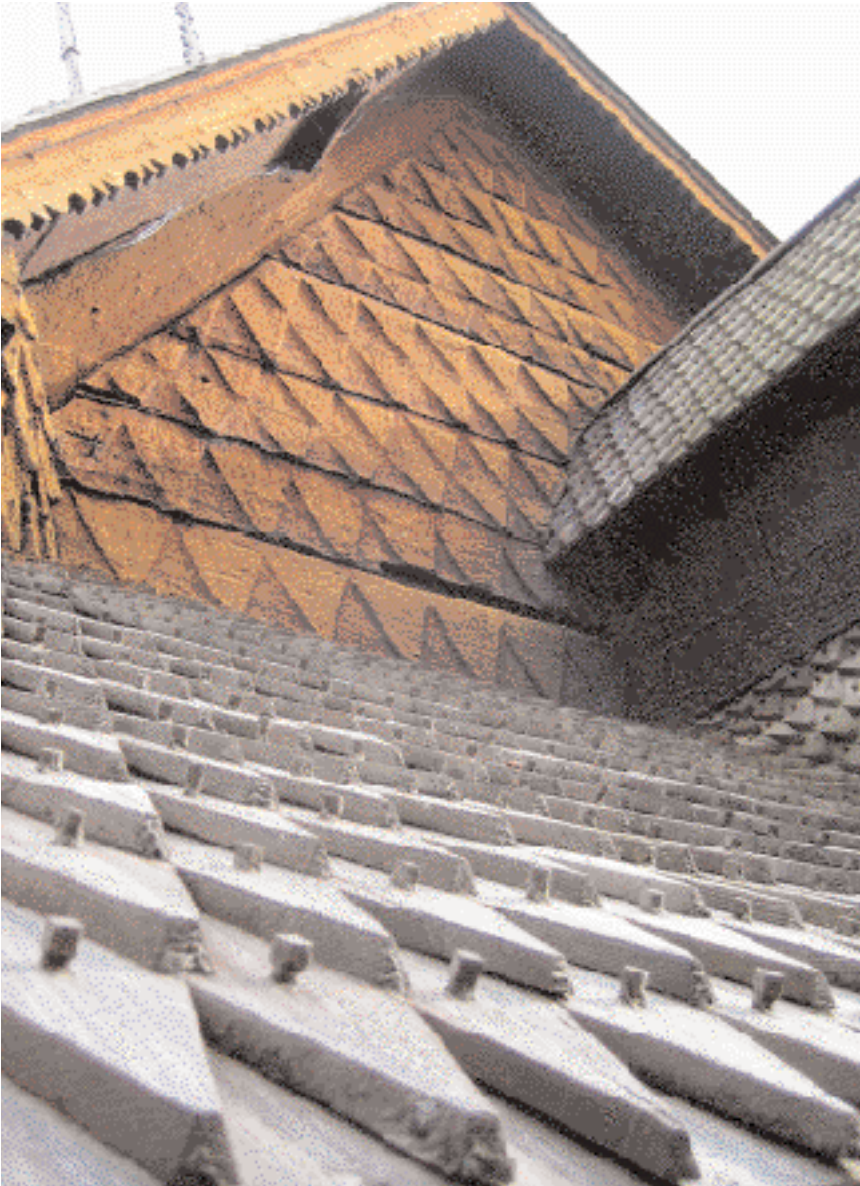
Spon var tidligere et mye brukt materiale til takteking.

antok at faren for belastning fra vær og vind eller fuktighet var størst.