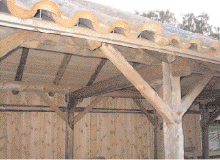
Grindverkskonstruksjonene baserer seg på prinsippet om at staven (den vertikale stokken), stavleggjene og betene (liggende) låses ved hjelp av treplugger og skråband.

bruket er det en variant av denne grindverkskonstruksjonen i løer og andre uthus, spesielt på Vestlandet.