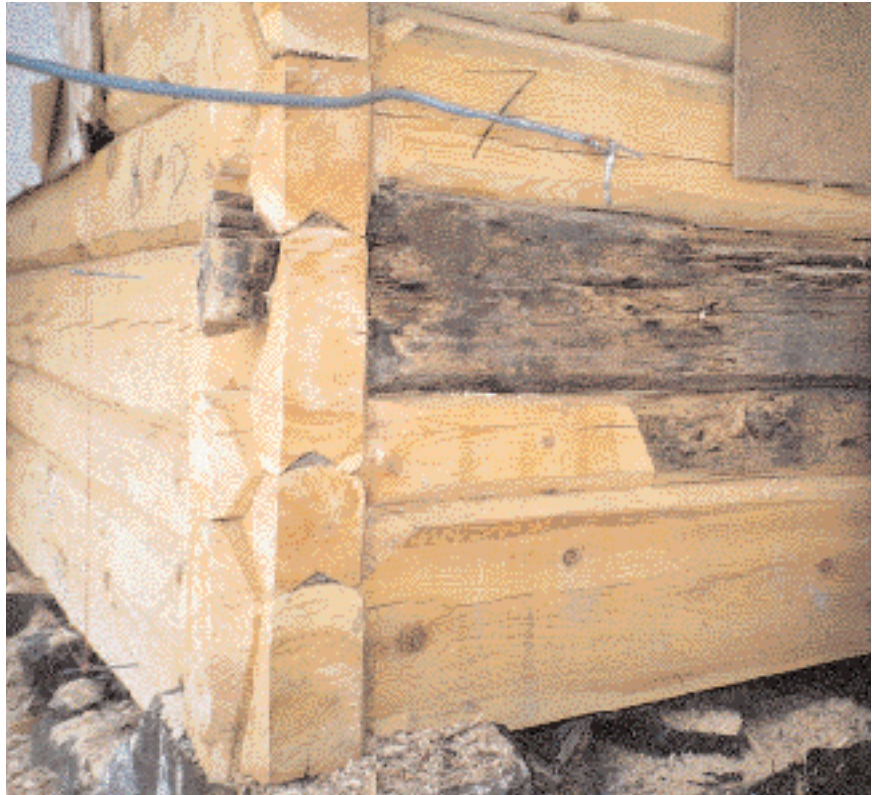
Eksempel på omfattende reparasjon av lafta hus. Det er brukt samme materialkvalitet og lafteteknikk ved restaurering som i opprinnelig bygning.

Erfaringsmessig er det i laftet, svilla og under vinduene at skader først oppstår på laftebygg. Større reparasjoner bør utføres av en erfaren tømmer, men mindre skader kan de fleste klare å utbedre. Prinsippet er å foreta oppretting/jekking fra