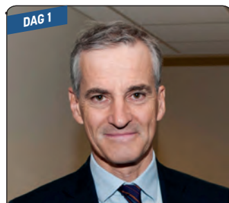
Jonas Gahr Støre